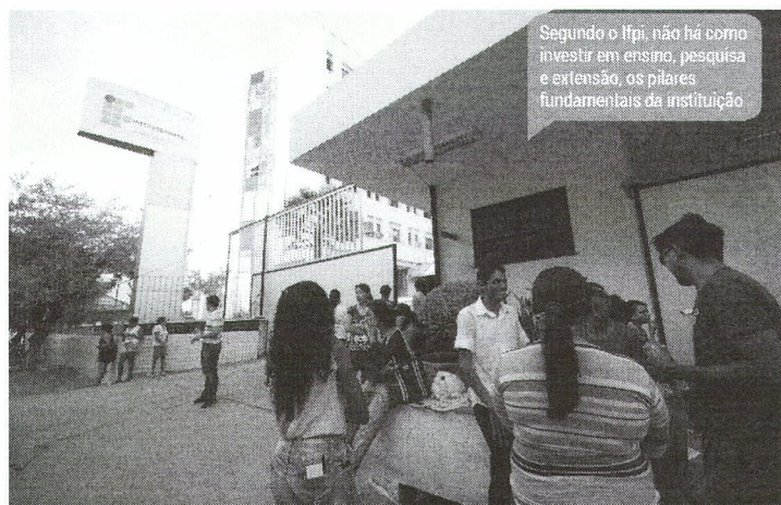
Segundo o Ifpi, não há como investir em ensino, pesquisa e extensão, os pilares fundamentais da instituição

Segundo o art. 131 do Estatuto da Criança e do Adolescente (Lei nº 8.069/90), o "Conselho Tutelar é órgão permanente e autônomo, não jurisdicional, encarregado pela sociedade de zelar pelo cumprimento dos direitos da criança e do adolescente, definidos nesta Lei".