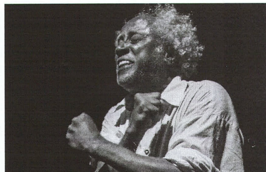
O monólogo teatral é livremente inspirado na obra de Lima Barreto, como o livro Diário Íntimo

Em paralelo ao espetáculo, o grupo também oferece a oficina "Cemitério dos Vivos", que pretende oportunizar aos participantes um enriquecimento e uma reflexão sobre o fazer do ator e suas implicações éticas, políticas e filosóficas.